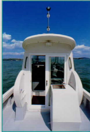
スライド式リアドア