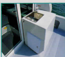
フィッシングギャレー