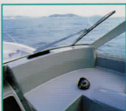
デフロスタ マリンコンパス