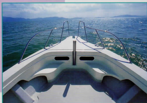
バウバルビット フェアリーダ