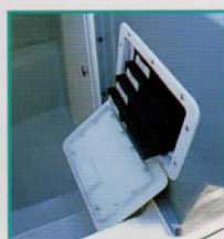
タックルボックス