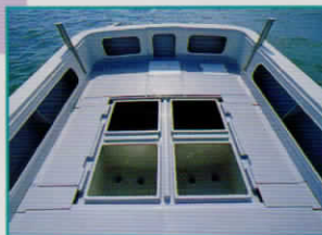
大形イケース+物入れ