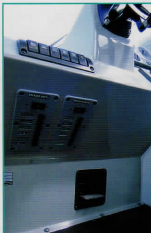
ブレーカパネル デフロスタ