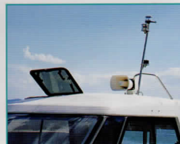
スカイライトハッチ 航海灯 マリンホーン マスト