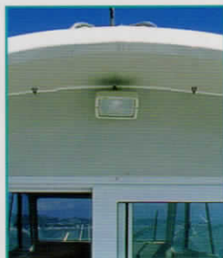
スタンデッキライト