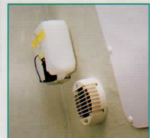
電動ベンチレータ