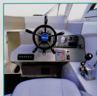
ヘルムステーション