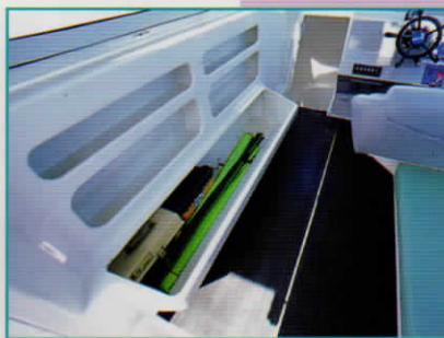
物入れ フロアマットはオプション