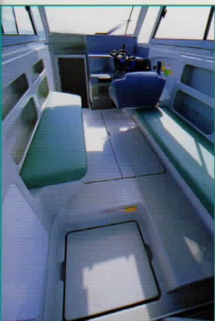
キャビン内 パッセンジャーシート