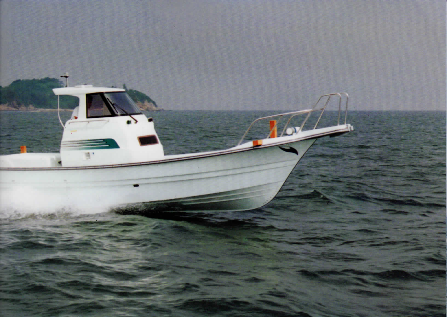
写真は臨時航行許可による走航