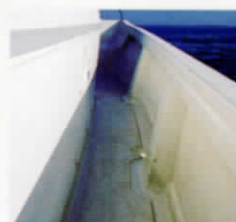
⑥ サイドデッキ/オープンガンネル