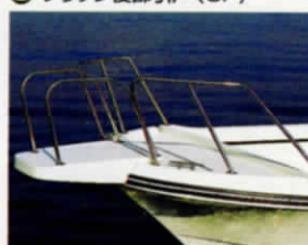
⑦ ハウスフリット&レール (OP) / パウレール (OP)