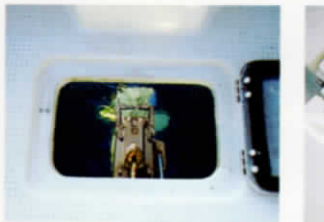
⑨ インスペクションハッチ