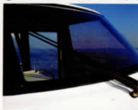
⑪ ワイパー&ウインドウオッシャー