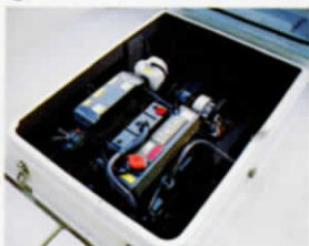
④ エンジンケーシングハッチ