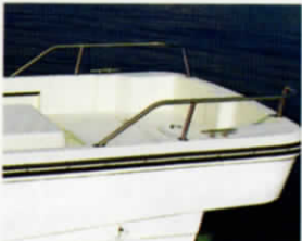
⑧ スターンレール (OP)