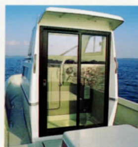
③ ブリッジ後部引戸 (OP)