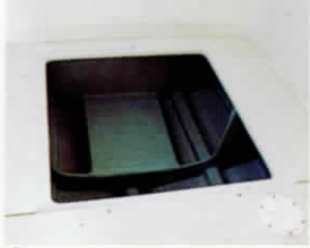
⑭ マリントイレ設置スペース (キャビン内)