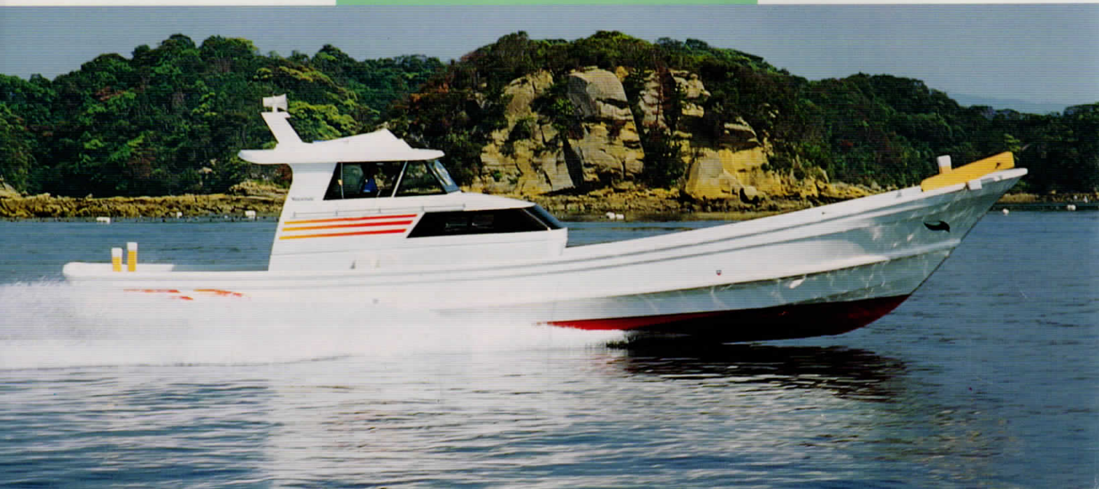
※写真は臨時航行許可による走航。

全長 13.25m 全幅 3.10m 全深 1.40m 総トン数 4.5G/T A仕様 (4.6G/T B仕様)